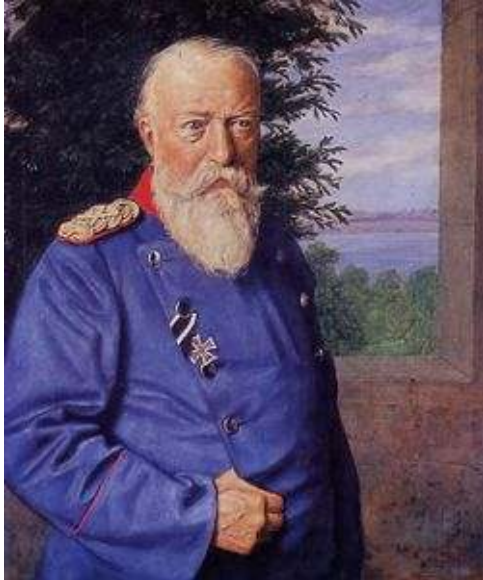
Storhertig Fredrik I av Baden

Strax före jul berättar ES om sin audiens hos storhertigen Fredrik I av Baden (1826-1907) 3 .”Vid