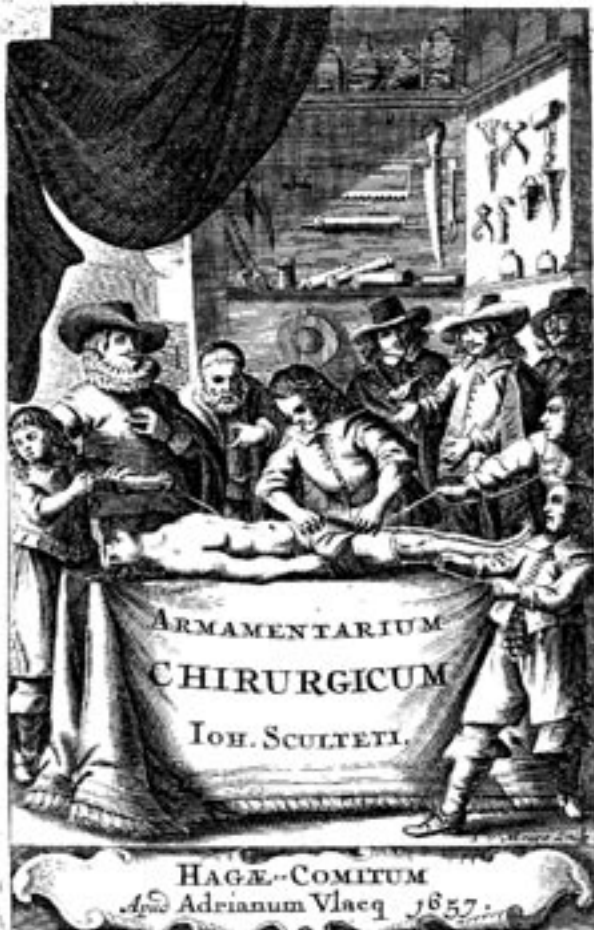
Planschverk med kirurgiska instrument och instruktionsbilder får antas ha varit tillgängliga även för kirurgerna i 1600-talets Stockholm. Här titelblad från Iohannes Scultetus' "Armamentarium Chirurgicum", (Den kirurgiska rustkammaren).