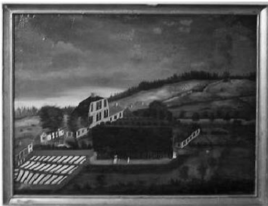
Sundby gård – mangårdsbyggnaden, som uppfördes på äldre grund år 1785 och revs år 1935 till förmån för chokladfabriken Marabou. (Foto av oljemålning ???).

fick stadsrättigheter. Sundbybergs gård, byggd på äldre grund år 1785, revs år 1935 till förmån för chokladfabriken Marabous nya kontorshus. Gårdens park är fortfarande öppen för allmänheten. 73 Kontorshuset nyttjas nu av bl a Sveriges Släktforskarförbund och Genealogiska Föreningen.