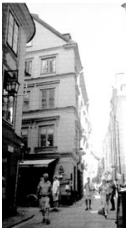
Huset i hörnet Svartmangatan/ Kindstugatan i Gamla Stan i Stockholm (Cepheus 6) – snett emot Tyska kyrkan - var redan under 1400-talet byggt i fyra våningar och tjänade som bårdskänarehus från mitten av 1500-talet. Det ägdes från 1624 till 1735 av medlemmar av släkten Salinus.

År 1624 kunde därför Balthasar Salinus förvärva ett tämligen stort och centralt beläget hus i Gamla Stan: hörnhuset Svartmangatan/Kindstugatan i Gamla Stan (kvarteret Cepheus; tomt nr 6) snett emot Tyska kyrkan. 66 Dess källare är, i likhet med